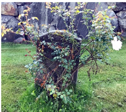
Ill. 2. Gravår på Skogskyrkogårdens muslimska kvarter.