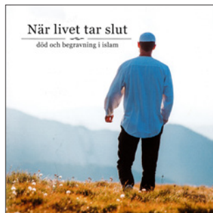
ILL. 3. Foldern När livet tar slut. Död och begravning i islam som delas ut bland annat i moskén på Södermalm i Stockholm.

Som så ofta formuleras sådana direktiv just på grund av att det inom folklig kultur är relativt vanligt med just starka känsloutlevelser i samband med sorg. I informationsfoldern kan vi också läsa att information om dödsfallet så snart som möjligt ska spridas till anhöriga och vänner och att alla uppmanas be om Guds barmhärtighet för den avlidna. Enligt traditionen bör man då påminna sig om den avlidnas goda sidor, och undvika att tala om hans eller hennes sämre sidor.