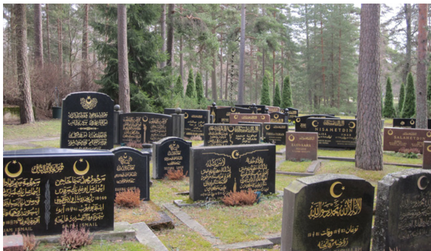
Ill. 6. Muslimska gravar med arabisk text.