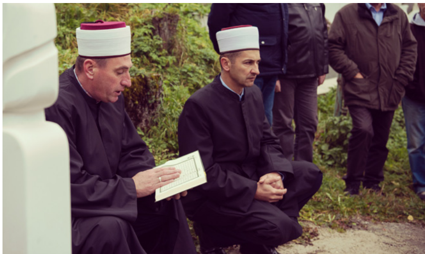
Ill. 4. Koranläsning vid begravning.

Efter koranrecitationen upprepar man åter igen Allahu akbar varefter man läser en bön om frid och välsignelser över profeten Muhammed. Därefter upprepar man ännu en gång Allahu akbar och läser därefter en bön över den döde. Slutligen upprepas för sista gången Allahu akbar . I vissa fall läses ytterligare en bön för den döde, i andra fall avslutas bönen med att man säger ”Assalamu alaykum wa rahmatullah” (Må Guds fred och barmhärtighet vara med dig). 19