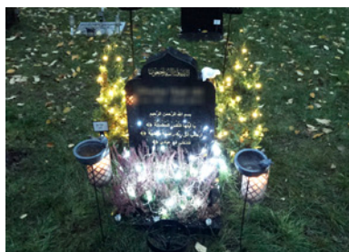
Ill 7. Bilder från Strandkyrkogården, Stockholm, Allhelgonadagen, 1 november 2020.

sina håll har man också noterat att detta även sker i samband med de kristna högtiderna, som vid allhelgona eller påsk. 39 Även Roland Vishkurti i Malmö har noterat detta att det blivit populärt bland muslimer att tända ljus vid gravarna. ”Att tända ett ljus vid gravarna är