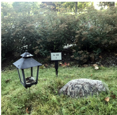
Ill. 1. Gravar på Ruds kyrkogård, Karlstad.