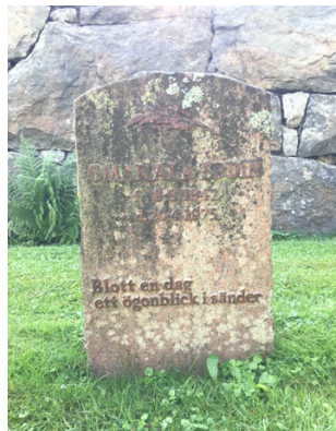
Ill 11. Gravsten med psalm 249. Skogskyrkogården.

Men sådana olika gränsrelaterade gravskick är inte bara relevanta för att analysera rela-