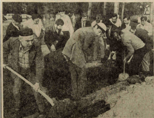
Sedan kistan sänkts i jorden, och den svidna placerten med ansiktet mot Mecca, fylles graven igen av den dödes trosbröder